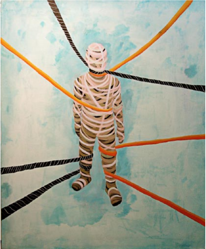
“La momia” 2007 Acrílico s/ tela 180 x 149 cm.